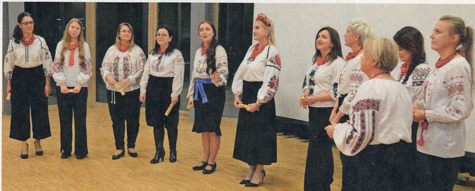
Der Chor «Perespiv» umrahmte den Dankanlass für die Freiwilligen im Flüchtlingsbereich. Mit ihren stimmungsvollen Liedern bewegten die Frauen aus der Ukraine die Zuhörerschaft.